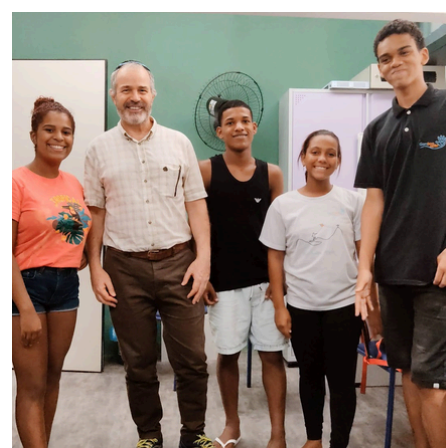
Educação e Cultura